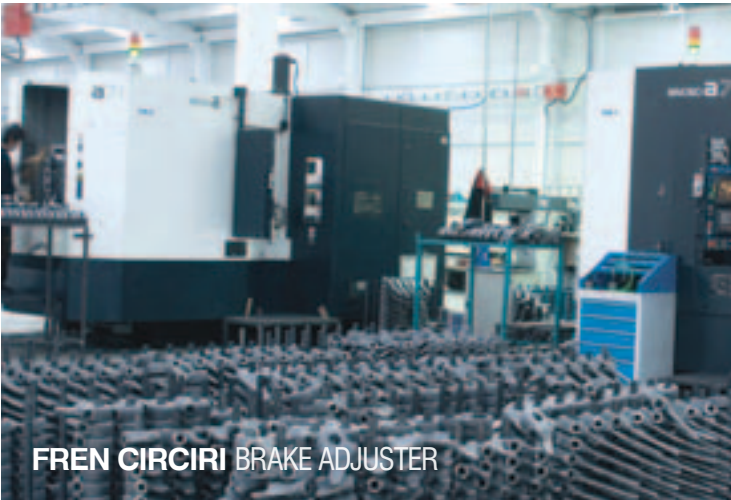
FREN CIRCIRI BRAKE ADJUSTER