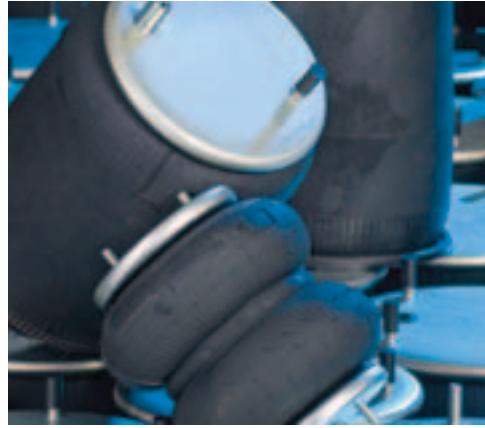
KÖRÜK AIR SPRING