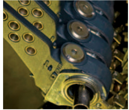
FREN CIRCIRI BRAKE ADJUSTER