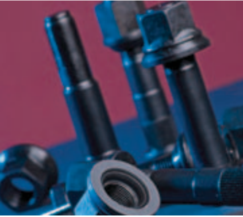
BİJON / SOMUN WHEELBOLT & NUT