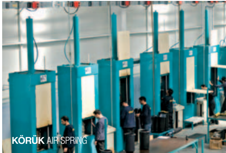
KÖRÜK AIR SPRING